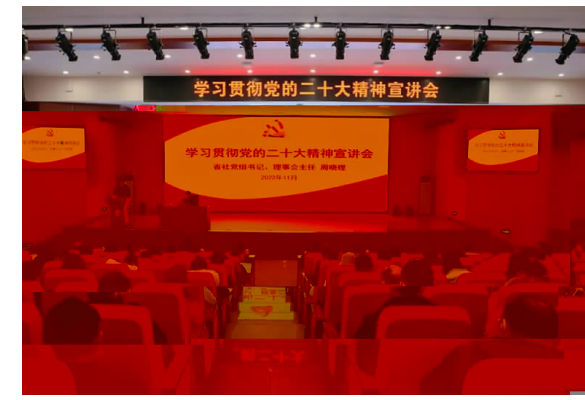
11月30日，省宣讲团来湖南宣讲党的二十大精神

依法沟通桥梁，注重呼声，解决困难... 2021年... 10... (通讯 易婧 摄影 欣)